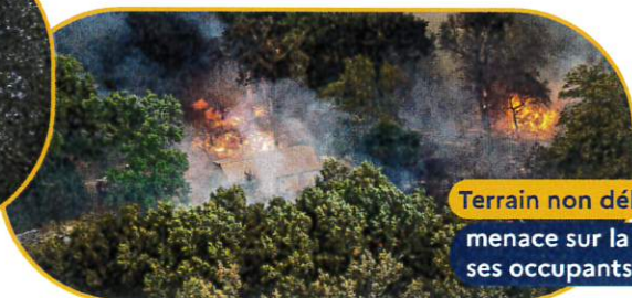
Terrain non débroussaillé

menace sur la maison, ses occupants et la forêt